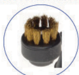
Spazzolino ø28mm vip setole ottone