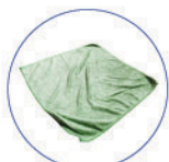
Tessuto microfibra 350 GSM 420X400mm