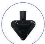
Spazzola triangolare c/velcro vapore vip