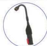
Lancia vap. KONFORT prolunga ottone 200 mm