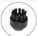
Spazzolino ø28mm vip setole nylon