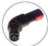
Raccordo spazzole vapore VIP