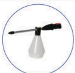
Nebulizzatore a vapore