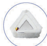
Panno triangolare microfibra velcrato bianco