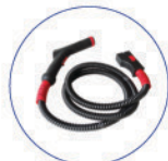
Impugnatura vapore VIP 2 mt