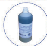
Detergente per chewing-gum 1 Kg