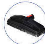
Spazzola rettangolare vapore VIP