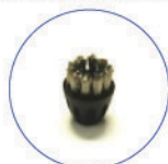
Spazzolino ø20 per MGK04N acciaio