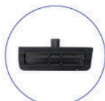
Spazzola rettangolare vap. c/velcro vip