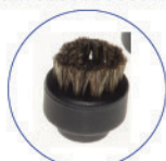
Spazzolino ø28mm vip setole crine