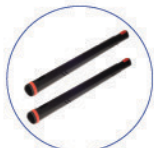
Prolunghe vapore VIP