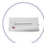
Panno microfibra velcrato 330x150 bianco