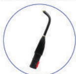
Lancia vapore curva ottone 12cm