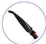
Lancia vapore VIP