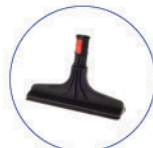
Tergivetro vapore VIP