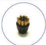
Spazzoline ø20 per MGK04N bronzo