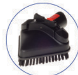
Spazzola triangolare vapore VIP