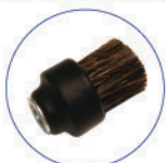
Spazzolino ø20 per MGK04N setole naturali