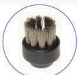
Spazzolino ø28mm vip setole acciaio